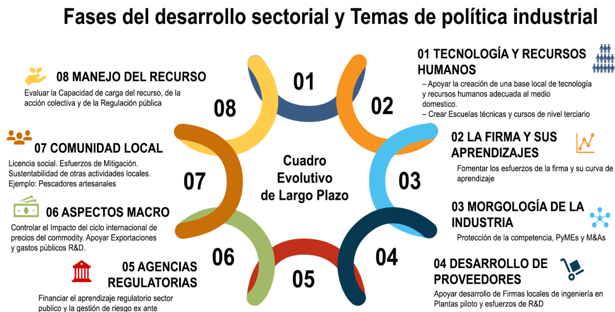
Gráfico 2. Fases del desarrollo sectorial y Temas de política industrial

En cada uno de estos campos se necesitan bienes públicos de diversa índole